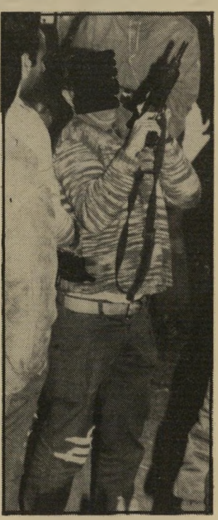
שלום במקום האירוע

כרגיל באירועים מסוג כזה, נכתב בשב"כ דוחאירועים ואיש בכיר בש"כ חותם עליו. ● 13.4.84 , יום שישי: ממקור רות צה"ל נמסר בבוקר כי ארבעת ה'חוטפים נהרגו בעת ההשתלטות על האוטובוס. בצהריים מפרסם דובר צה"ל הודעה משופצת, שלפיה מתו