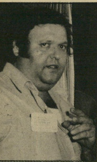
מזכיר רו במרכז הקשר

כדי להבטיח את שילטונו הקים אוניקובסקי קואליציה עם פעילים מהליכוד, מהתחיה, מהמפד"ל ואפילו עם אחד מ"כך" — עובד התעשייה האווירית בלוד.