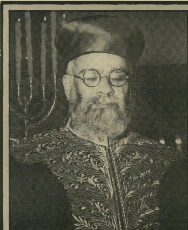
הרב הראשי ניסים בן שישי מתוך שיבעה

א חד מחבריהכנסת הליבר-ליים מעיד עליו שהוא תוצר של (המשך בעמוד 36)