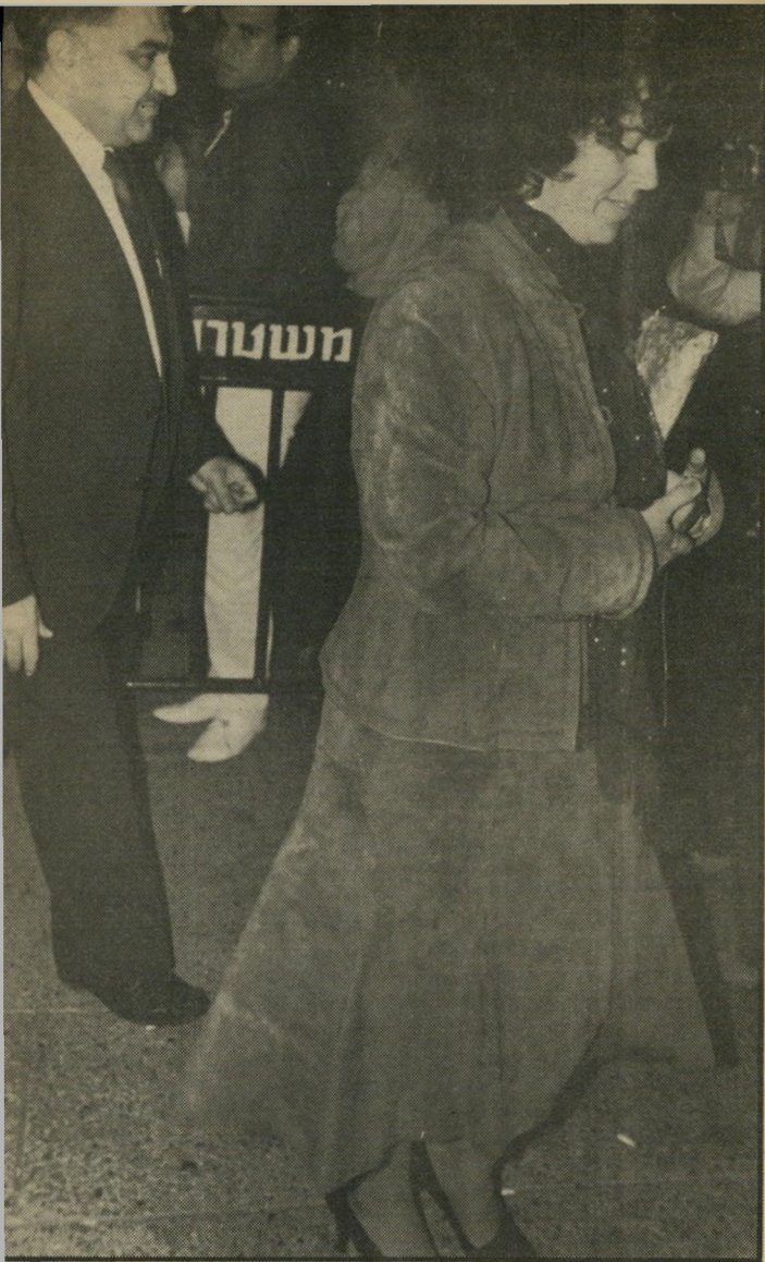
השר ניסים ואשתו הבינוניות השקטה תצמד לניצחון.

הנפוץ במישרר חשוב זה. מודעי שאיר אחריו מישרר-אוצר חזק. הוא שיפר את מעמדו של המישר רד, שנחלש בשנים שלפניו. הוא החזיר לפקידות הבכירה את העוצמה שנל" קחה ממנה מאז תקופת יורם ארידור. ניסים נכנס למישרר מוכן, והתחיל ללמוד את הנושא מן היסוד. תכונותיו הבסיסיות: סבלנות, שקדנות, יסודיות, התמדה, יכולת לשמוע ולהאזין, לויא ליות, שיתוף המערכת בקבלת החלטות. כל אלה עזרו לו בעבר, ועוזרות לו עתה.