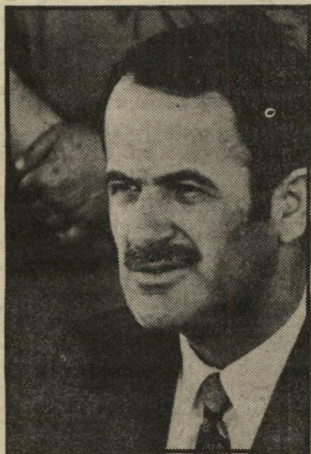
אסד עם אמל נגד אש"ף

במחנות הפליטים בלבנון חיים מאות אלפי פלסטינים כצל של סכנת-שואה. מנוי וגמור עם ראשי המארגנים במדינה לגרש אותם, ואם יש