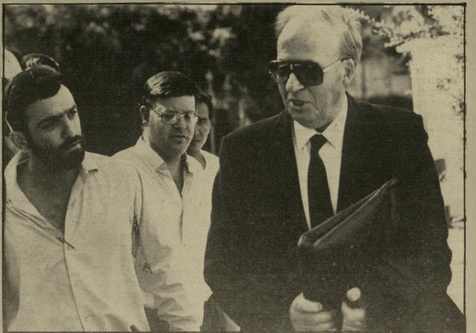
יועץ-מישפטי חריש ועיתונאים בבית-המשפט העליון לא עמד על העמידה

רגע האחרון לפני הדיון מסר היועץ המישפטי לכל העותרים את תשובתו. אליה צורפו מיספר