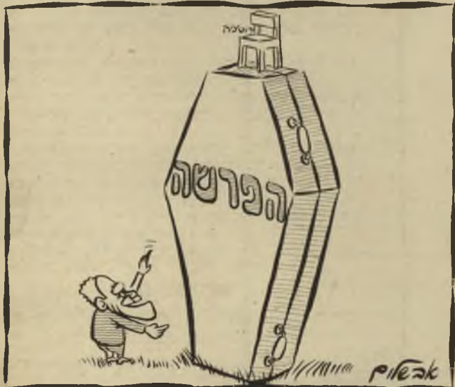
"אבל אני לא מגיע!"

מבטאים את דעת הרוב העצום של הציבור הנאור.