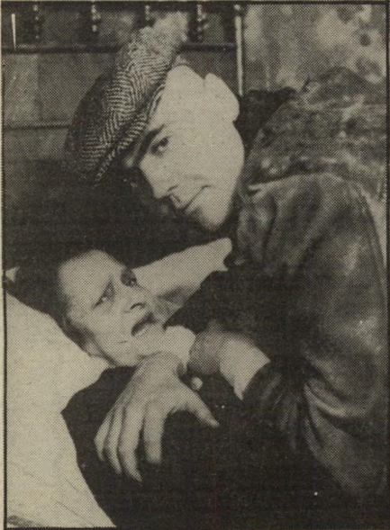
שנת השמש השקטה. טרם הגיעה השעה

מתחילה היתה תוכנית הביקור מוזרה במיקצת - יממה אחת בלבד. האם כראי כל המאמץ?