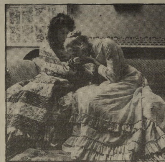
ואנסה רדגרייב וג'סיקה טנדי - המייגעות

המושבעת, המשוחקת באופן גרוע ופריג'ידי להפליא על-ידי ואנסה רדגרייב.