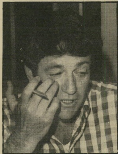
עורך רועה היד הארוכה הגיעה

כתבים, אנשי קול, מפקים, פרשנים וטכנאים יצאו למכסיקו. בתקציב של חצי מיליון דולר. את מה שהם שידרו, אפשר היה לראות גם אצל השכנים ממזרח, שלא שלחו למכסיקו אף לא כתב אחד, ולמרות זאת שידרו את כל מישחקי המונריאל.