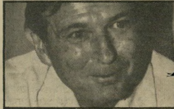
סופר אופק שמונה בעיקבות אחד

התפטר ♦ בגיל 78, מכהונת נשיא בית-הדין השופט העליון של