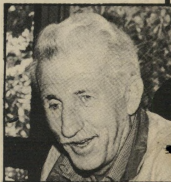
השר נחמקין להפלות אותם!

ע סקנים בליכוד, שעיניו היטב במיסמך, טרם החליטו איזה שימוש לעשות בו. הם מהססים עדיין אם לעורר סביבו פרשה חדשה ומשבר, לנוסף בהתרגנות הכיתית של המערך, ולאיים בפירוק הממשלה — דבר אשר עלול לשבש את הרוטציה