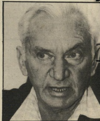
השר בר-לב שהציבור יידע!

בשלב זה אירעה תקלה המורה. עותק אחד נשלח בטעות גם ללישיבתו של אחד משרי הליכוד. בלישיבתו של השר המקבל לא התעוררה כל מהומה. הכתבים המדיניים לא הועקו. שרי הליכוד לא התכנסו לדרון בצעדי-גומל. איש לא התרגש. הסיבה: המיסמך היה מונח כאבן שאין לה הופכין, במשך שנה שלמה, כי לישיבתו של השר, מבלי שאיש טרח להציץ בו.