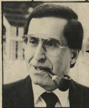
השר שחל שיתקתי את אריק!