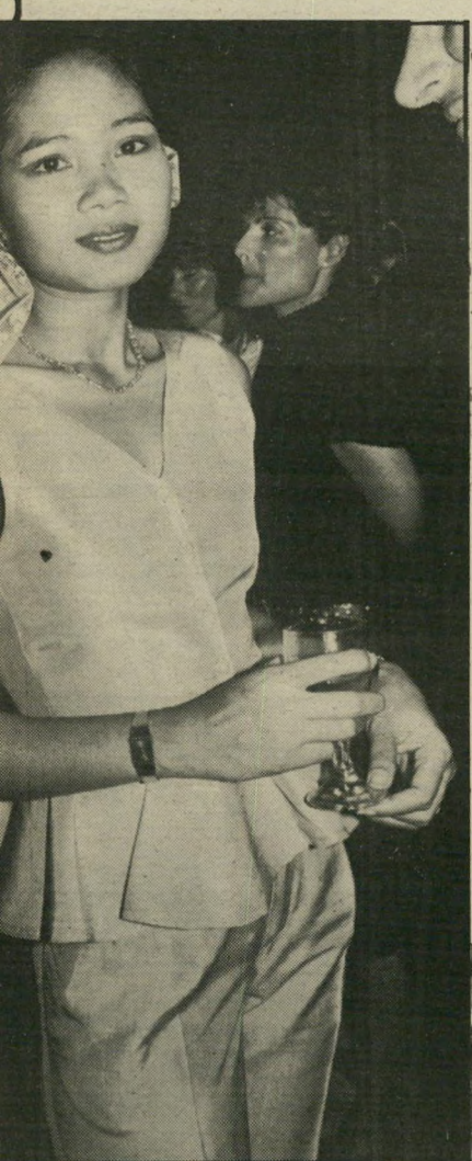
סאוואלי בונטון עשית טוטו היום?