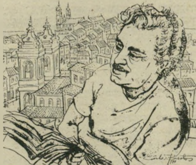
ז'ורז' אמאדו: דיוקן צייר קארלוס נאסטוס

אחד מספוריו הקצרים היפים ביותר של המספר הברזילאי הגדול (נכתב ב-1949), ערות חותכת לכך שברזיל תרמה לתרבות העולם לא רק את הפיזיומון השירי, את פלה, האגרי, את הקארנבל ואת הקפה. כמרבית יצירות אמאדו, מתרחשת גם זו בסאלבאדור שבנאהייה האהובה