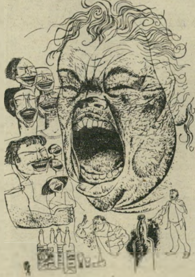
קינקאס שואג'מים: יותר מדי יין שרף

לפי בחירתם, היה, כמובן, גם שרה-חינוך והתרבות ונשיאנו לשעבר, יצחק נבון. והנה, יצחק נבון, כשיקול הרעת ונבועם ההליכות ומתקדשהו שלו, שהיו כבר לשם דבר, המליץ... על איזה ספר המליץ, לדעתכם? שמה הצביע שרף החינוך-התרבות על ספר שירה או פרוזה מקורי שראה אור בישראל, לאחורונה? שמה המליץ על ספר הגות או מסה, או אולי ספר מחקר שראה אור בשנים האחרונות ולדעת שרה-חינוך ראוי שגם הקהל הרחב יידע על קיומו? ואולי, בהאמינו כי אין עתה סיפורת ישראלית מקורית בעלת ערך, הצביע השר המופקד על ענייני תרבותנו על ספר מתורגם חשוב, שהיכרותו עמו תביא את הקורא לגילוי סופר שלא הכירו או להתמודדות עם רעיון שלא שיערו? לא מניה ולא מקצתיה.