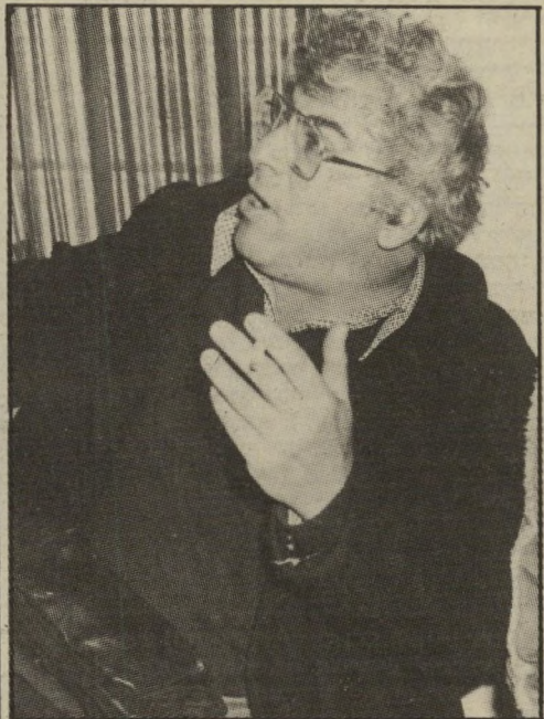
מתווכחים בנבנישתי ואברזיאד אתה מדבר כמו מושל צבאי?

שלוש עכשיו פנו אל יצחק רבין. שרה-ביטחון היפנה את הפעילים למתאם-הפעולות-כשטחים-הכבושים. זה