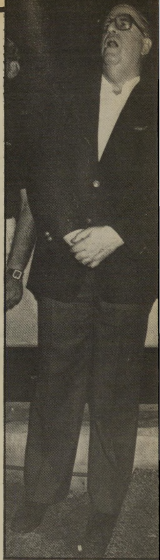
ח"כ אבן המצע מעל לכל:

מיפגש לא פחות מעניין הוא זה שלא התקיים. כמה שבועות אחרי הדרושה בחבי רון, שבררך אליו הוכו שוחרי-השלום ונערכו חברון מהומות על-ידי התחיה כך וגושי-אמונים, ביקשו פעילי שלום עכשיו לערוך כינוס דומה בעזה. הם רצו לשתף בכינוס את רשאר אל-שווא ורופא מקומי, אך נאמר להם כי אלה אינם מייצגים עוד את הלך-רוחו ברצועה. הערבים הציעו שותפים אחרים, אוהדי אש"ף. שלום עכשיו הסכים. הערבים העמידו רק תנאי אחד: ששלוש עכשיו ישיג היתר למיפגש מטעם הממשל הצבאי. אחרת היתה