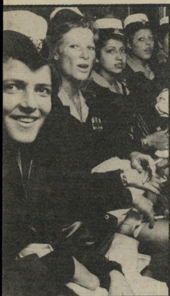
שוטרות יותר מדוי

הארצי, לדוגמה, נופחה מעבר לכל סרפורציה. בין השנים 1977 עד 1979 גדל מיספרם של עובדי האגף מ-72 ל-149 איש, עליה של יותר מ-100%. גם מחלקות מנהליות אחרות במטה הארצי גדלו בשיעורים דומים. נראה שהמפכ"ל הנוכחי מודע לבעיה, אך