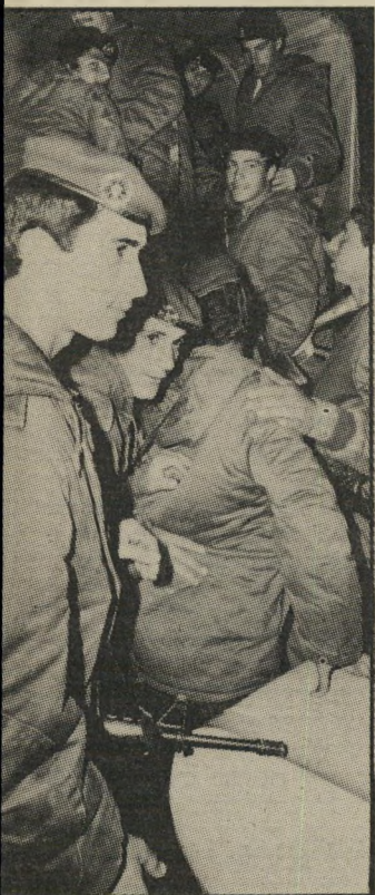
אנשי מג"ב מודל לקינאה