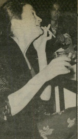
כימאית פולני בלעדיה

שלוש שעות התעככה יצר אתו של צוות ההפקה של הטל-וויזיה, שהיה אמור לצאת להפיק קת תוכנית קריית-שמונה. במיסגרת שידורי המחלקה למסורת ישראל יצא צוות לצלם סרטים לתוכנית מכל מקום על קריית-שמונה. כשנודע לחברי הצוות כי במלון בקריית-שמונה יצטרכו לישון שני אנשים בחדר אחד, הוריעו במפתיע שניים מחברי צוות ההפקה כי אינם מוכנים לכך. הגימוק; נחירות רמות של אחד מחברי הצוות. אחרי משאומתן מייגע, איר חור של שלוש שעות ועצבנות בקרב הצוות, הגיעו לפשרה וה עניינו סודר: השניים לא ישנו בחדר אחד.