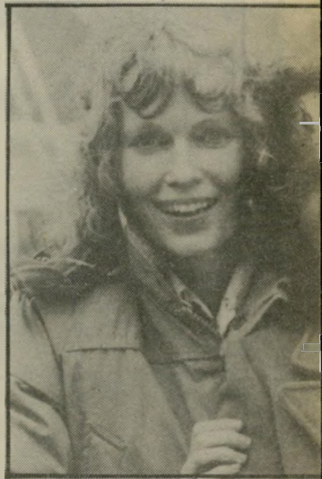
מיה פארו ב.הנה ואחיותיה מחוץ לתחרות הרישמית