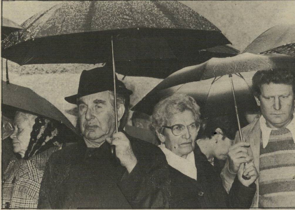
ומאות מיטריות נשלפו ונפרשו. וכך, מתחת למיט"ריות שחורות, הספידו שימעון פרס ויצחק בן-אהרון את גלילי. לצידו של הנשיא עומדים האלמנה ובנה.