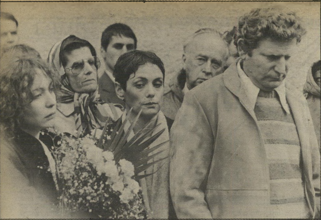
אילת, מאחוריה לאה רבין, בקצה התמונה בתו של שלמה, שהיא תלמידת תיכון יפה, שהתרגשה מ"הצלמים הרבים ולא הפסיקה להתלחש עם אחיה.