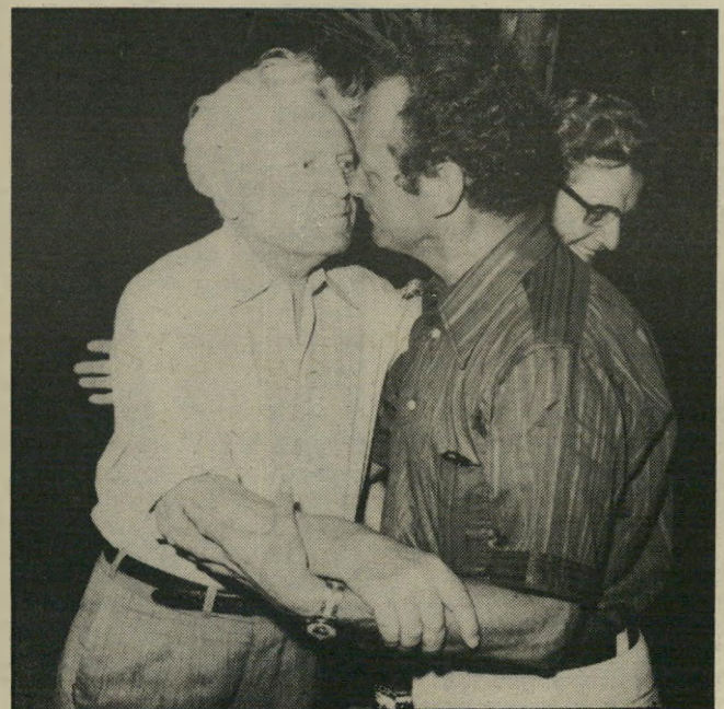
עם אלון בכנס ותיקי הפלמ"ח תוכנית לסיפוח ביקעת-הירדן