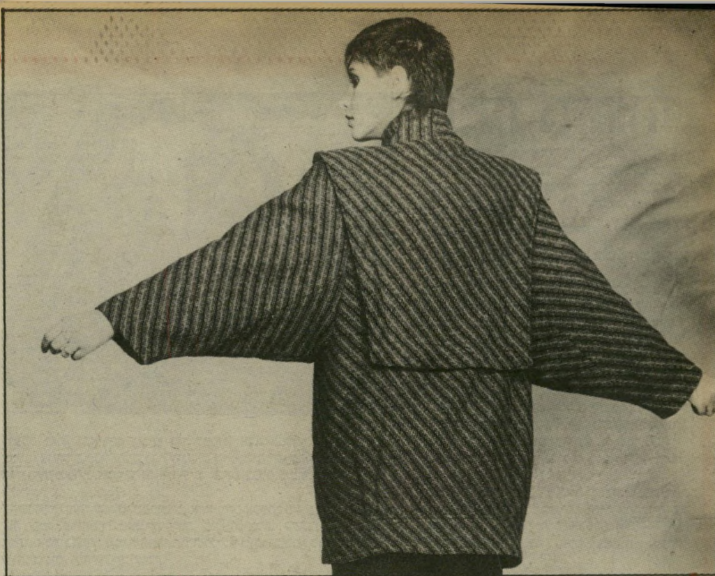
השרוול רחב ונוח, בסיגנון עטלף, מעיל אלגנטי וספורטיבי לכל שעות היום והערב. את צווארון הסרפז ניתן לנצל ביום גשם - ככובע לשעת צרה.