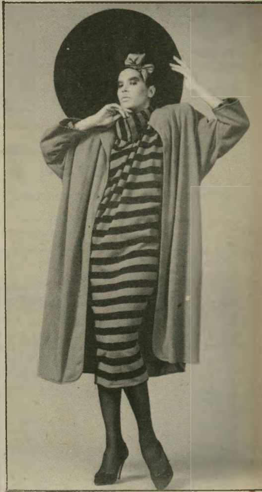
כחול מזעזע סריג אנגורה רך, נעים, מחמם ומלטף, ממנו עיצב רזיאלה גרשון מעיל אשר כתפיו מודגשות.