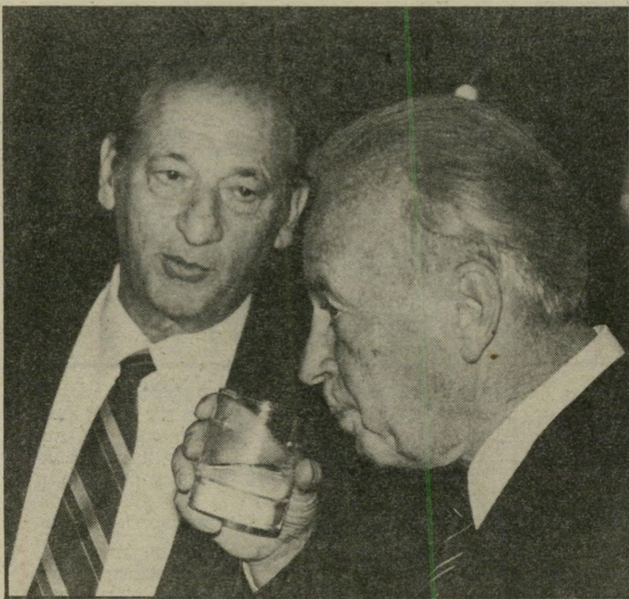
שרי-כיטחון רבין השבועי מי שקבע רגשות, לא מוח אנאליטי

טרור נגרנו ממשך לשגשג. הרגש מצווה: מוכרחים לעשות משהו. מוכרחה להיות תרופה כלשהי. אם הפעולה הקודמת לא הועילה, צריכים לבצע פעולה יותר גדולה יותר חזקה, יותר מדהימה. ואז, כשבאה הודמנות פיתאומית וצריכים להחליט בלי הכנה מוקדמת, מחליטים על פעור לות חסרות-שחר כאלה.