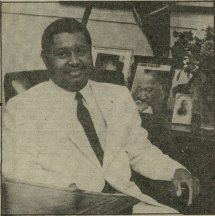
בייבידוק אשה בשיבת ממשלה