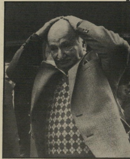
בורק אלמוזלינו מעבר לכל הגיון כלכלי

כתב אלמוזלינו: "נוצר מצב שההנהלות דרשו לעצמן לחתום הסכמים עם שחקנים, לפעמים מעבר לכל הגיון כלכלי, בלי לדאוג לכיסוי כספי והעמידו את מועצת-הפועלים בפני עובדות. מועצת-הפועלים השלימה עם עובדות אלה