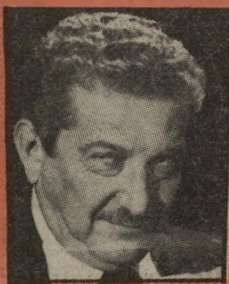
עזר וייצמן מיספר פרטי

● איך הסתדרה שי-חתי-הטלפון של שימ" עון פרס עם חוסני מובארכ, בבוקר שאח-רי החלטת-הממשלה על הסכמתה לבוררות טא-בה? הרעיון היה של עזר וייצמן, והוא האיץ בי-ראש-הממשלה לעשות זאת מייד. אולם בכל בניין מישר-די-אש-הממ"שלה לא פעלו הטלפונים. לבסוף נמצא טלפון אחד שפעל, אך אז התברר כי לאיש אין מיספר הטלפון במעונו הפרטי של מר-בארכ. וייצמן לא הת-ייאש וטילמן למוצטפה ח'ליל, ראש-הממשלה המצרי לשעבר, ושאל או-תו מה דעתו על הרעיון שראש-הממשלה היש-ראלי יתקשר עם הנוסח המ-מצרי. ח'ליל התלהב לרעיון, ואז ביקש ממנו יש מוקשים לא-מעטים.