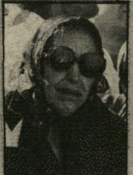
ישעיהו לא הפלה

נה פעולת-גומל למדיניות הקיצוצים כלפי משרד-הבריאות. ההר הוליד עכבר, ובכך, מעט אחת ולתמיד, למען הסדר הטוב: מלכי תחילה לא התכוון גור לחשוף את השמות הכל-כך מבוקשים, מכיוון שדבר כזה הוא בניגוד לאתיקה הרפואית. הרשימה, אגב, מחוץ סי- ציונית מהחושם שנוצר באמצעי- התיקשות. המדובר בהתקציב ב- סדר-גודל של 195 מיליוני שקלים. כשליש מהסכום הזה — 70 מיליוני שקלים — נועדו לטיפול באלמנטו של ישראל ישעיהו המנוח, מי שהיה יושב-ראש הכנסת. לנברת ישעיהו מממנים אחות צמודה, סכום נוסף, קצת יותר קטן, מוקדש לסיעוד אלמנתו של חבר- הכנסת המנוח אהרון גולדשטיין. נהנית נוספת היא חברת- הכנסת לשעבר חיה למדן. כלומר: ללא שום קשר לסוגיה אם אכן מגיע טיפול רפואי בחינם למיוחסים, לכל ימי חייהם. הנהגות העיקריות מהסכום המוקצב לכך, על-פי החוק הנוכחי, אינן נשים שנסעו לאירופה, כדי למתוח את עורן או למנוע הריון בלתי-רצוי, כי אם אלמנות קשישות.