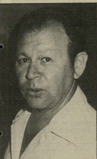
שר גור פליטת-יפה

ראס-בורקה בוצע פשע נתעב. על כך אין ויכוח. ממשלת-מצריים חייבת לציבור הישראלי רוח ברור והודי-משמעי על מה שאירע, איך ומדוע. אחרי הרצח ירדה על הציבור הישראלי הנדרם מהלומה שניה. נמסר לו כי לפחות חמישה מבין שבעת הקרבנות של החייל המצרי המשתולל לא נהרגו מייד ביירות, אלא מתו בעקבות היחס הרשלני והבלתי-אנושי של החיילים, הקצינים והשילטונות המצריים, שמני-עו הגשת עזרה אשר יכלה להציל את חייהם. הם מתו מאיבוד-דם, שניגר במי-שך חמש השעות שבהן מנעו המצריים מן הישראלים שבקירבת מקום — ובניהם רופאים — להציל את בני-מישפחותיהם.