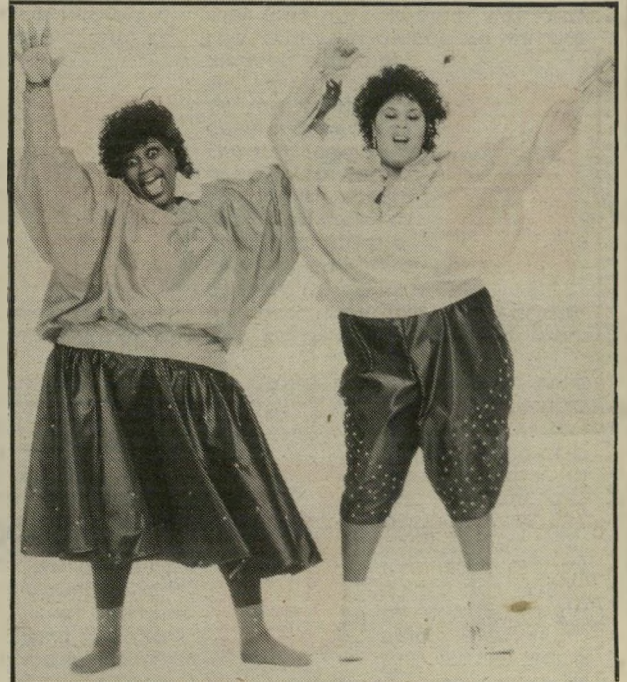
נערות מזג-האוויר שני טון

בשנה שעברה שלט במיצעדים להיט ענק, שנקרא יורד גשם, הל-לויה! שרו את השיר שתי כושיות עני-קיות ככנות 40. בכת אחת הצליחו הנשים, שהסתתרו מאחורי השם נערות מזג-האוויר, לגרום להיט-טריה המונית. שתי הנשים, שעד אז הסתפקו