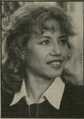
חוזה אלברשטיין סוד