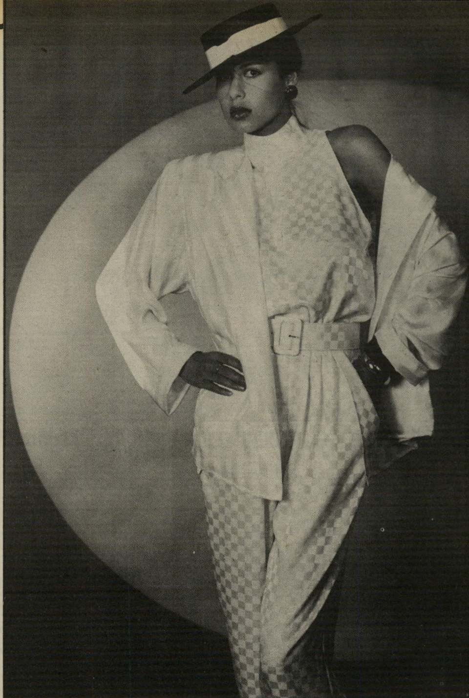
מוכנס מנימה בסיגנון רגלן, הצווארון גולף עומד, הכיסים גדולים וכפל מעטר אותם וחגורה רחבה מבד במותניים. ז'קט מאותו סוג בד, בהדפס שונה.