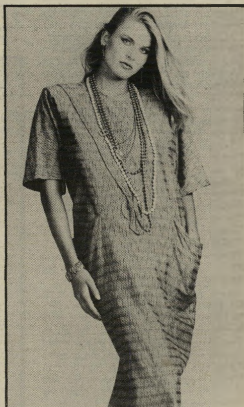
מעצבת טנה, רשת 30 החנויות, עיצבה שימלה מבד מקומט בסיגנון שק רחב וארוך. שרשרת הפנינים מוסיפה גם היא יופי.