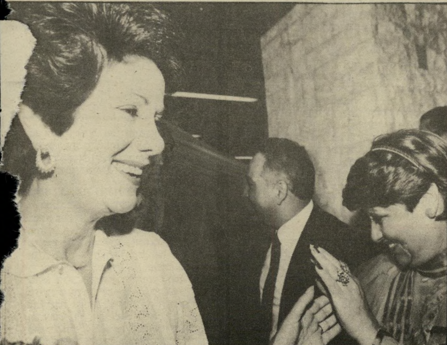
של שר-האוצר. במרכז נראה מוחמד בסיוני, מיופה-הכוח. מודעי בא מוקדם למסיבה ועזב מוקדם. הוא מיהר לפנישת המשאומתן בין הממשלה להסתדרות. מגישה שנקבעה לאותו הערב בתל-אביב. המשאומתן בין הממשלה להסתדרות, אגב, התמוצץ באותו לילה.

מבין חברי-הממשלה נכחו (רשימה לא מלאה) ראשי-הממשלה, שימעון פרס, שהסתובב בחצר הגדולה מלווה