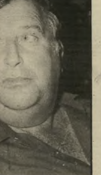
בייגה שוחט ראשי-הערייה היה הרוח החי צע הארוחה, כשמעריץ טפח על כתפיו

מה יש בתל-אביב חוץ מאוויר מצחיק, רווי עשן-מכוניות? אקשן לילי בלתי-פוסק, בארים ובליוויים. ומה יש בערד, חוץ מאוויר צח ויבש? שיעמום אטומי. כך לפחות היה המצב, עד שהמציאו פרנסי-ערד את הפסטיבל הנושא את שם עירם. למסיבה לכבוד הפסטיבל, שבו ישתתפו, לריכרי המארגנים, רק אמנים ישראלים, הוזמנו אמנים, בימאים וחי-שוכים אחרים. אבל התעוררה בעיה. הקהל הישראלי הרגיל אולי יסכים לנסוע עד ערד, אבל לא החשוכים, המפורסמים והמפונקים. עכורם, תוכי-ננה המסיבה של פסטיבל-ערד במוע-רון שמיים, על חוף-הים של תל-אביב, כמובן. מסמר המסיבה היו כמה עשרות קילוגרמים של דגים טריים, שהובאו למועדון הישר מסירתו של דייג חרוץ. לא, לא מהים של ערד - שם אין ים - אלא מהים של יפו. הדגים המיס-כנים הועלו מייד על האסכלה והוגשו לנזכחים עם פיתות חמות. אבל הפרט הראשון בפסטיבל יבוא מערד. יהיו אלה שלושה פסלים שגולי-פו מאבן-ערד. בגלל קושיה של האבן,