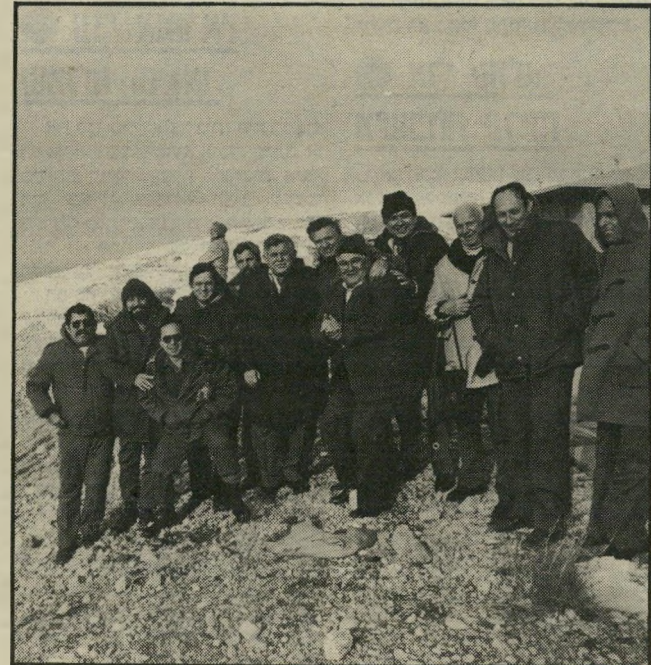
ועדת-החוקי-הביטחון בלבנון הבורות חוגגת

על כל פנים, כאשר הבינו ראשי המארונים כי הסטאטוס-קו אינו יכול להימשך, הם החליטו להקים תרופה למכה ולהתנפל על יריביהם. לפני שאלה יתנפלו עליהם, אין ספק כי מילחמת-האזרחים הלבנונית הנוראה, שהחלה ב-1975, החלה ביוזמת ה-מארונים. בסמכם על העזרה היש-