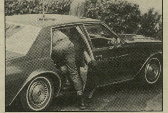
רמטכ"ל לוי רמטכ"ל לוי ממשיך הולם לרפול...

כרגיל, התחיל הסיפור מדליפות קלושות-למראה, בעלות סבירות נמוכה ואמינות שנויה במחלוקת. אנשי לישכת שרי-הביטחון נהגו לדבר בזול-למה על הרמטכ"ל הנוכחי, רבין אלוף משה לוי, ואחד מהם נהג לכנותו, במינוח-הכנסת ובמקומות אחרים, כי "ממשיך הולם לרפול". מפיהם של אנשי יצחק רבין ניתן היה להסיק שהבוס שלהם סבור כי מאז שהוא עצמו נטש את כס הרמטכ"לות, הירדרד הצבא ללא הכר.