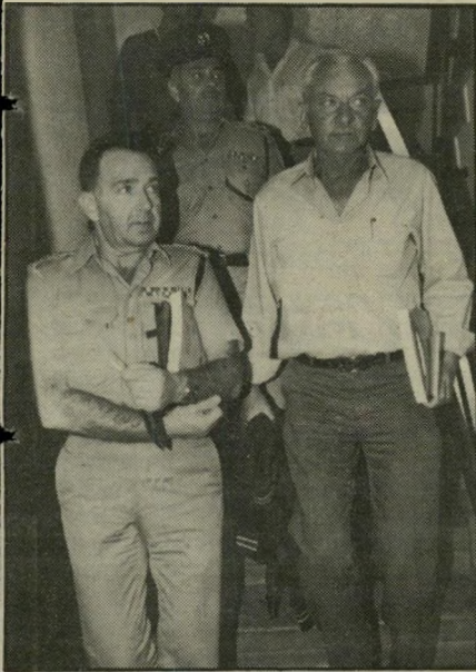
ברלב, קראוס ואיבצן המנצח על המלאכה

בריוק מה דעתו של טופז על הנשים ואיזה מקום בריוק הוא מייעד להן. זה מזכיר לי מה שקרה לאחרונה אצל שכנינו בדרום: כמה מיליונרים סעודיים התקוממו כאשר ראו מה הם קיבלו במישלוח האחרון של הרולס-רויסים '85 שלהם.