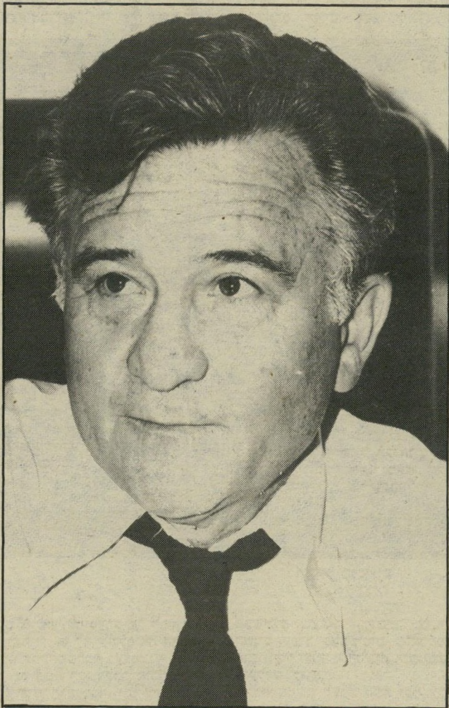
שופט רביבי מוצא לנכון להעיר...

לרון במעמד שני הצדדים היתה שלא לרוחו, כתב השופט רצ'בסקי בהחלטתו, למחרת אותה שיחה טלפונית. השופט החליט כי אחרי שיחה זו לא יוכל להמשיך לרון בתיק. "לכשעצמי, אין לי ספק שאני יכול לרון בתיק ללא משוא-פנים או דעות-מוקדמות, גם לאחר פניה זו של ראשי-העיריה", כתב השופט בנימוקי החלטתו, "אולם אני מניח שלא כל