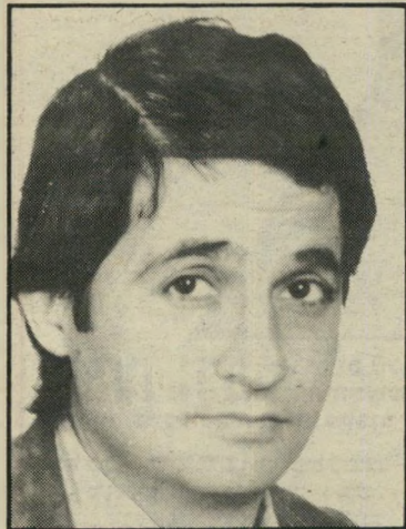
כתב נרב התוכנית שובשה

את המיבוקים בשעות הלילה, הלכווחים משידורי הטלפרינטרים של סוכנויות הידיעות, עורכים ומשרדים אנשי-מילואים של התחנה, כחלקם אנשי קול-ישראל אמון נרב , כתב קול-ישראל לענייני מילגלות, נקרא לשירות-מילואים ביום ה-