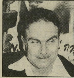
אמוראי אהבות מכל הלב

קצב, שהחיוך חתם קבע אצלו עד למינויו כשר, מוטרד ללא הרף מבעיות מישרו, וגם כשהוא נמצא במינון