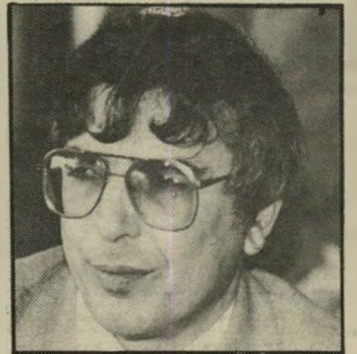
אבו חצירא עדיפות לפאריס

תמי משמיעה חיחרורי-התפרקות אחרונים או לא — אבו חצירא, מנהיגה, לא שינה ממינהגיו המאופקים אך היקרים. בימים שבהם לא טייל בחינה-יעולם (עם עדיפות ברורה