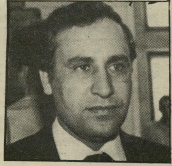
קצב חשיבות חדשה

לעולם לא תפגשו בו מסב בצוותא עם עמיתים לממשלה או לכנסת. שולחנו במינון עמוס תמיד יועצים, דוכרים ועוזרים לרוב. גם אם נותר כיסא פנוי, אל דאגה — איש לא יצטרף לשולחן. לרבינין יצא שם של איש בודד וחשדן כרוני, ולכן זהו