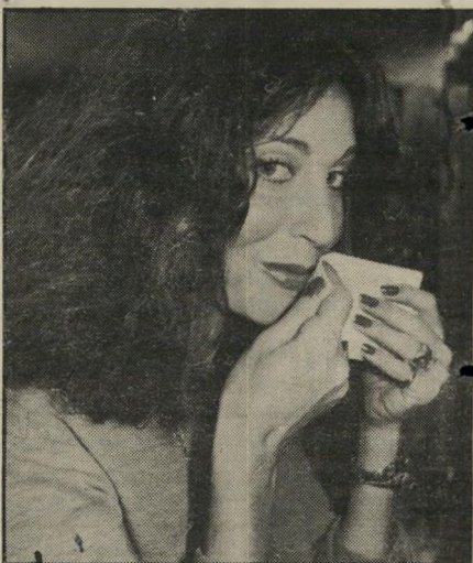
חני פרי חוף מ-דבר המועלת

אני מצאתי אותו במיקלט ציבורי בבתיים, אחרי שלקח מהוריו בפעם השלישית את הטלוויזיה הציבועונית, כדי למכור אותה ולקנות סמים. מאז שידור הכתבה, לפני פחות משנה, יש בכל פעם מישהו הטורח להפיץ שמועות בתל-אביב שאייל חזר לסמים, אבל זה לא נכון.