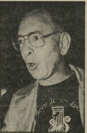
במאי מוסינזון מהקיבוץ לשגרירות

אומתה בלימה, בירת פרו, אחר שבע שנות תחקיר, והותה של