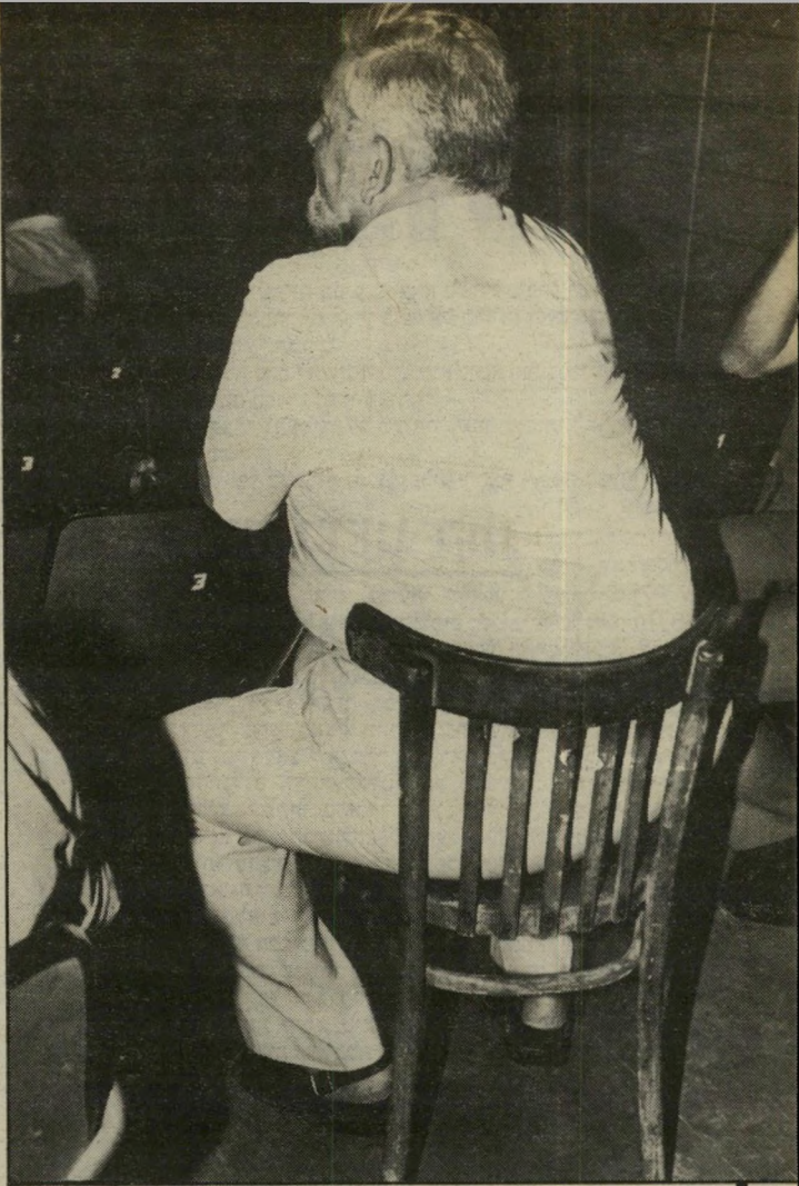
ח"כ צבן — לפני הדיאטנה פועלי אתא סירבו להרים...!

מצב־הרוח מכתוב לו גם את תדירות הג'וגינג, שהיה להיט בעבר הלא־רחוק. לעומת זאת, הוא דוגל בשחיה יומיומית, פעמיים בשבוע, בימי שהותו כירושלים לצורך עבודתו בכנסת, הוא מזנק לבריכה שבמלון רמדה רנסנס ב־05.30 בבוקר, מי שלא מאמין — מוזמן להיווכח במרעיוניו.