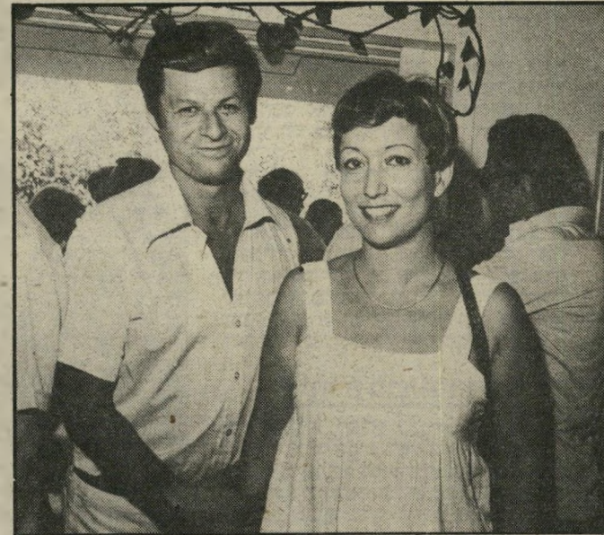
היבנים מה משדרים?