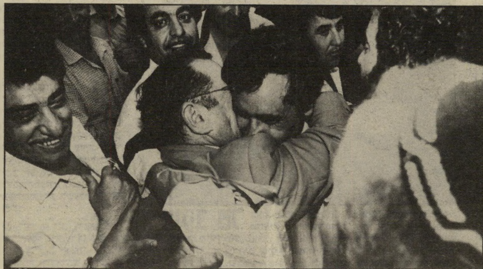
נשיקה לקצב, לרגל בחירתו, במרכז חרות. אולי אין הרבה בחורים אשכנזיים שעבדו קשה!