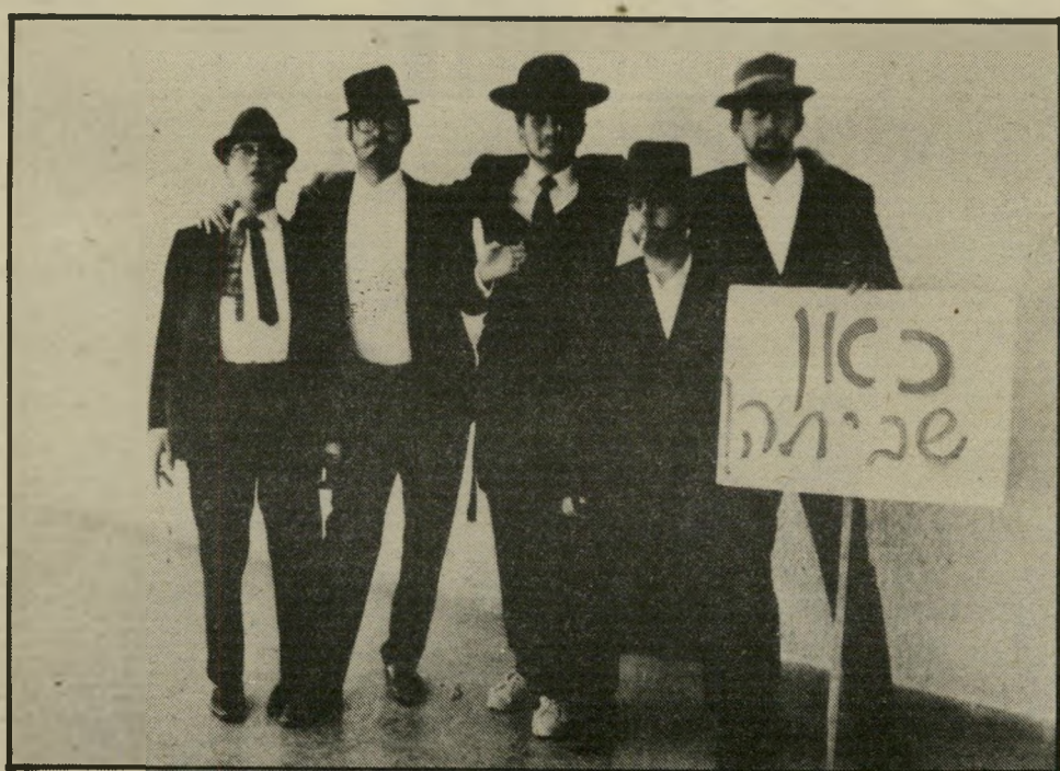
פורים. בגיל 15 יצא את הישיבה והלך למכור שעונים בשוק הפולני בתל־אביב. אז גם הפך חילוני וטעם חשיש. לאחר מכן שירת כשריון ולמד מישפטים.

למרות שיכול היה להתגייס כקצין, בגלל עברו בצה"ל, החליט להיכנס לשורות המישטרה כשוטר פשוט ביחידה המרכונית. אחת כך עבר קורס־קצינים, שירת