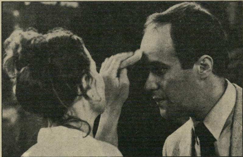
מנחה פאר בשעה טובה