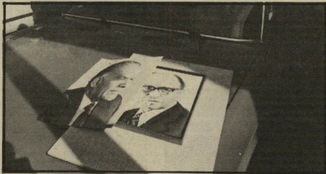
שמיר למיסגרת תמונתו של יצחק שמיר נלקחה למיסגור כדי שיוכלו לתלותה יחד עם תמונות ראשי-הממשלה לשעבר.