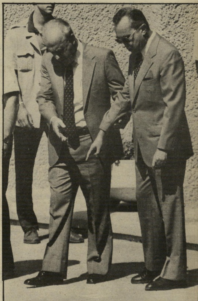
איפה לעמוד? שר-הביטחון היוצא משה ארנס. והנכנס, יצחק רבין. מצביעים בנפרד על הנקודה הלבנה, שבה עליהם לעמוד בטקס החילופין במישרד-הביטחון.