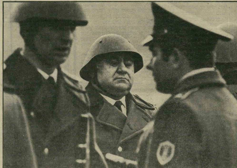
חייל מזרח-גרמני (מומוז) וחיילים סובייטיים בברלין המזרחית בוז לסובייטים הכושלים

שחלו בהונגריה וכפולין, החלו גם אנשי גרמניה המזרחית להשתנות. הנטייה הטיבעית היא להת