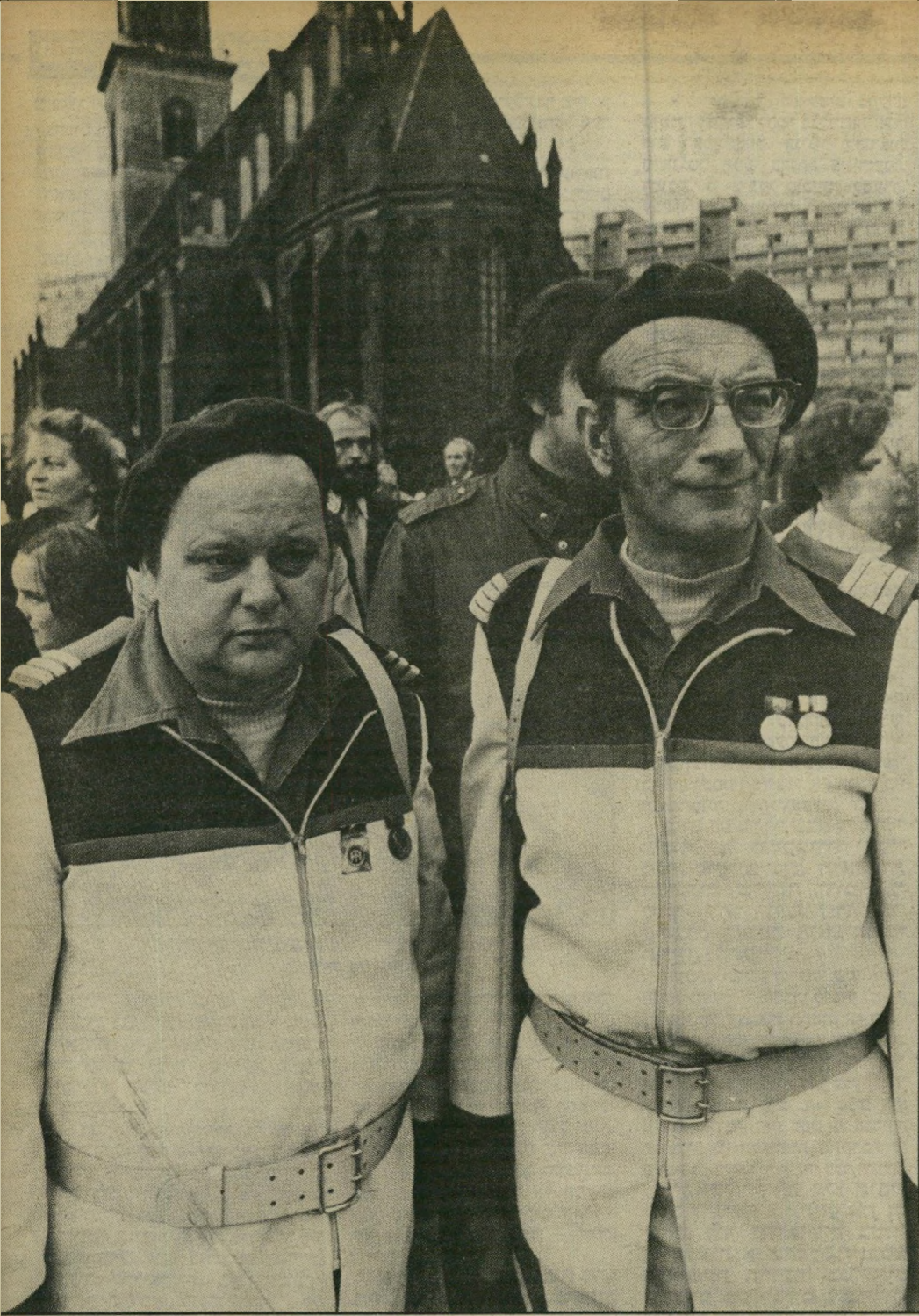
צעירים בגרמניה המזרחית: תזמורת. הנוער הגרמני החופשי כמו בדיחה יהודית ישנה

המילחמה בויהום הסביבה, המאבק לצדק סוציאלי ודברים טובים אחרים. זוהי תנועה אנתנטית גדולה, שצמחה מלמטה. אחד מביטוייה הוא מיפלגת הירוקים, שהפכה למיפלגה השלישית בגודלה במדינה. תנועת השלום הגרמנית קיבלה צביון אנטי-אמריקאי חריף, ועל כן הוחשדה לא פעם כאילו היא פועלת בשליחות הסובייטים. אך מחוץ לסוכנים הקומוניסטיים, שחררו אליה מדרך הטבע, זוהי תנועה גרמנית