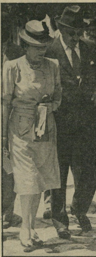
חיים וייצמן (ראשתו ורה) התנים ייללו בלילות

מיימו הראשון, כאשר לא רק היווים עוררו את וייצמן, אלא גם סר ארתור ווקופ (חורו עם סירופ), סקוטי