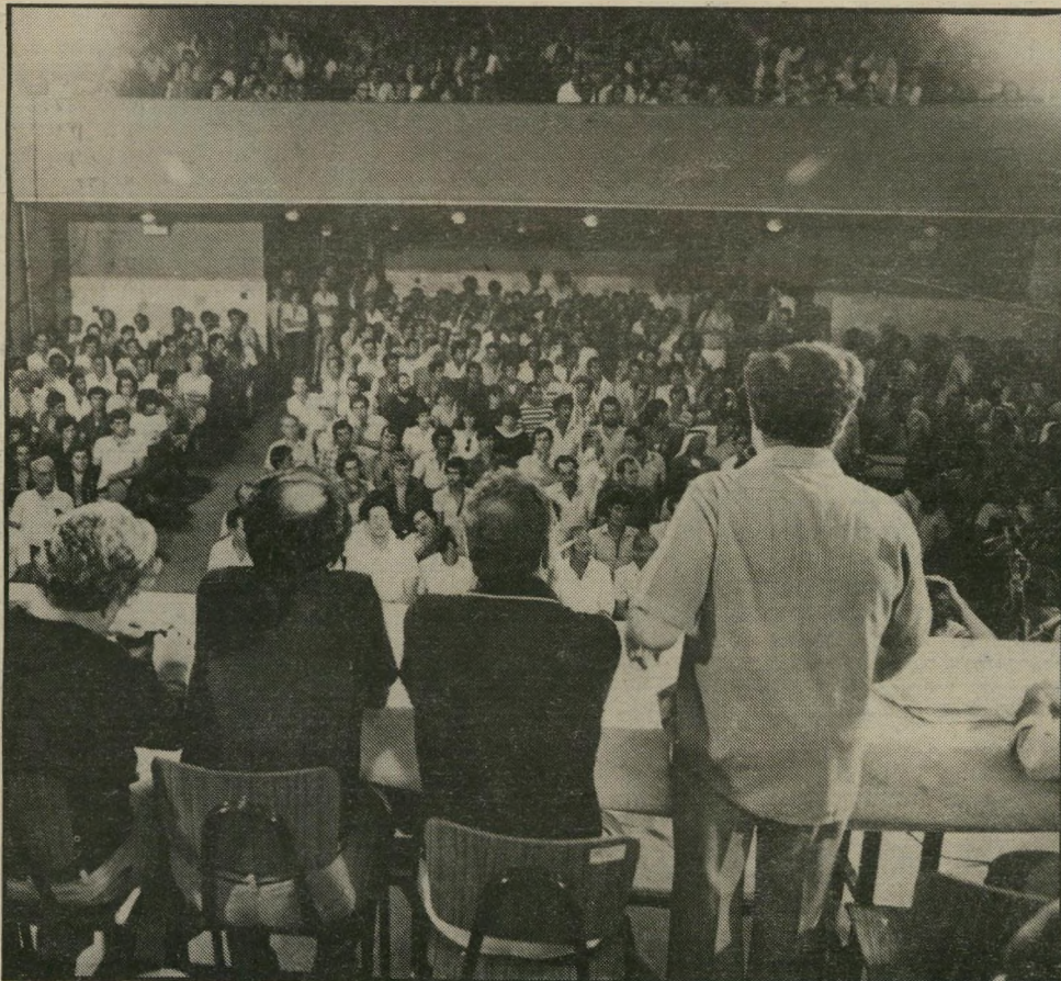
חלק מ-1500 היהודים והערבים בכינוס נצרת הערבים תיגרמו ליהודים

ב כל פעם שדיבר נואם ערבי, בקהל מרכינים את ראשיהם זה לזה,