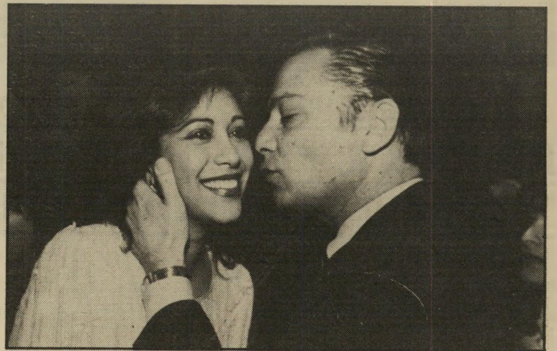
ברנית חזה ומנהל סער נסינות בוטר