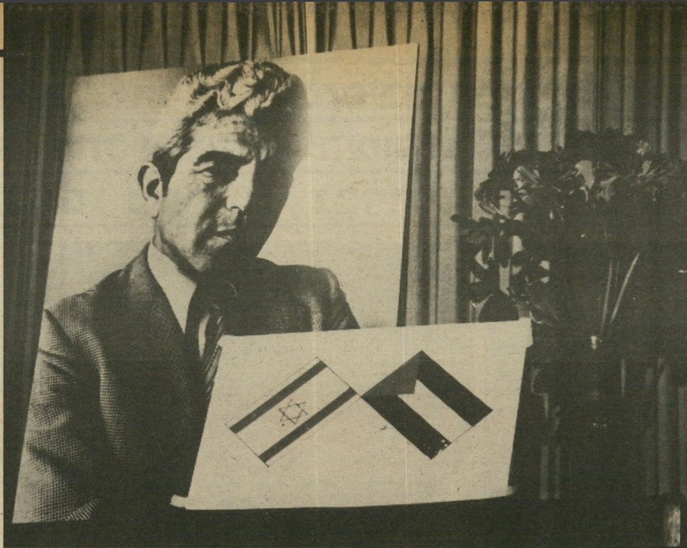
שני דגלים ופרחים הדגל המלסי' אדום שחור לבן) והדגל הישראלי (כחול לבן). שהם טיני (ירוק) עמדו על הפסנתר. בצד הימני, תמונתו של ד"ר סרטאווי, קורבן הדו-שיח.

כי דרך זו, אשר למענה שפכנו דם יקר, היא הדרך המוסרית. הדרך הפטרויטית... קולו של האיש בקע מתוך רשמקול קטן. תמונתו עמדה על פסנתר חום בצד הבימה, ולידה צינצנת-פרחים צנועה. כאולם הושלך הס. הכל הקשיבו לדברים שבקעו מתוך המכשיר. לרגע נדמה היה כאילו הוא שם. עיניו כאילו דיברו אל הקהל הרב שישב כאולם. אך עיצאם סרטאווי לא היה כאולם, שבו נערכה אזכרה וחלוקת פרסים על-שמו, במלאת שנה להירצחו. הדרך השלישית. חודש לפני הרצח הופיע עיצאם סרטאווי ביחד עם אורי אבנרי באסיפה כלונדון, שם אמר, בין השאר: ... כאשר התחלתי להילחם למען השלום, גיליתי מה פירושה של הכריות של לוחם השלום. גיליתי שדרוש אומץ-לב גדול פי מאה כדי להילחם למען השלום... קטע מבריו אלה השמיע אבנרי, מעל גבי הרשמקול, באסיפה שנערכה השבוע. ערכים ויהודים, פלסטינים וישראליים התקבצו ביחד באולם הקטן בתל-אביב, ולולא השפות השונות שדיברו בהן, קשה היה להבחין ביניהם. היו שם פלסטינים מן השטחים הכבושים, ערכים מן הגליל ויהודים מכל הארץ. (המשך בעמוד 70)