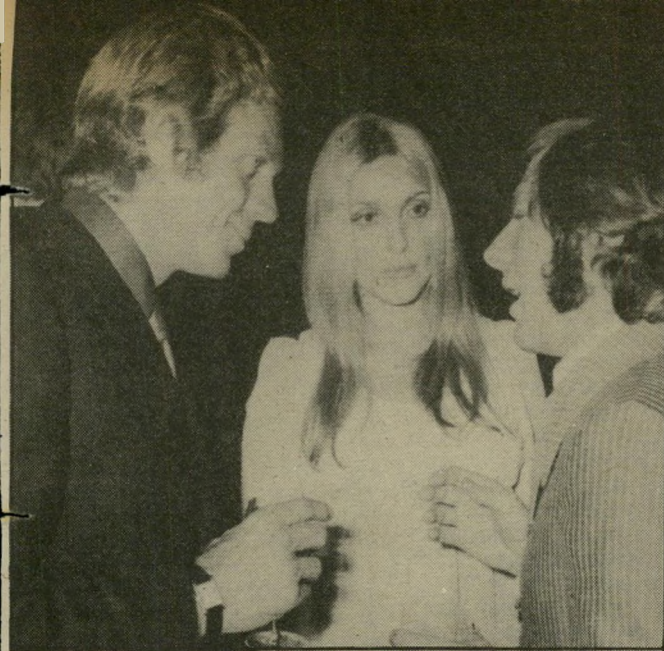
פולנסקי (למעלה) עם שרון טייט וסטיב מקווין ומשמאל - עם נאסטסיה קינסקי