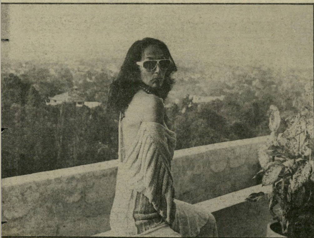
עיר הבירה של האיטי. אתי מעצבת סוודרים מכותנה ואף מדגמנת אותם (בתמונה: על רקע הנוף של עיר־הבירה). בתמונה למעלה, מימין: חוף־ים בהאיטי.

אתי הודיעה שלא נחכה לה למחרת. היא צריכה לנסוע לצפון, לקלאב מדיטרנה (מועדון היס־התיי