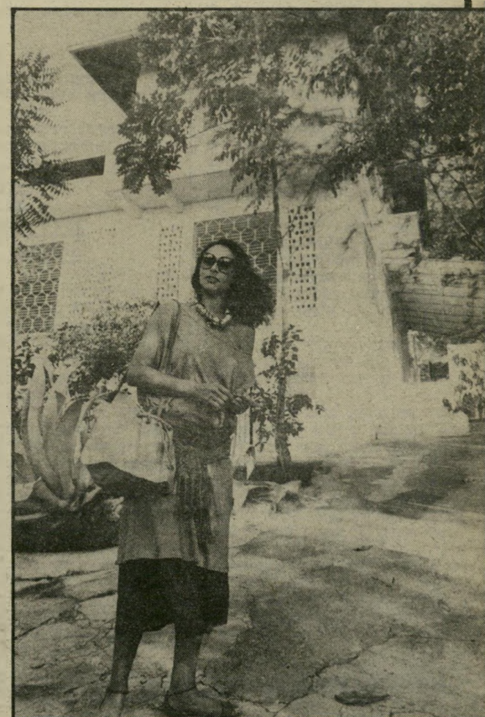
בית בפורט־אופרינס אתי א" לוף ב" חורה ישראלית, מצאה את ביתה בפורט־אופרינס.