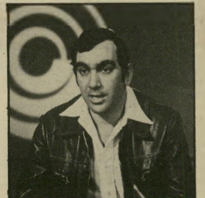
כתב מישעל סקופ כפול

לפיוור הכנסת. למחרת, המשך מישעל והביא את הסקופ על שיבתו של עזר וייצמן לפוליטיקה, בראש מיפלגה חדשה שהוא עומד להקים. שבוע הסקופים של חטיבת-החדשות שכ ומוכיח שכאשר יש סיפור טוב, אין כמדיום הטלוויזיוני כדי לפוצץ אותו.